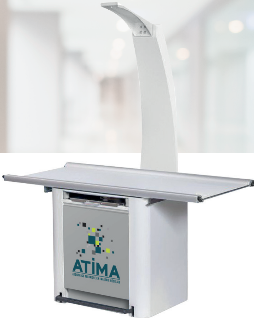
Table de radiologie pour générateur portable